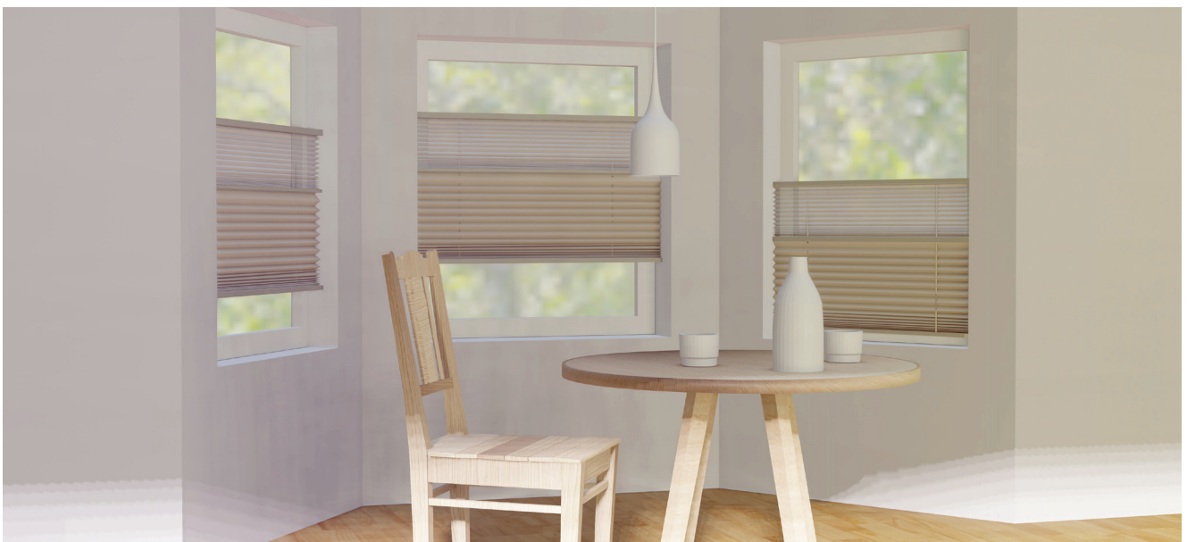
Kahe kangaga voldikkardinad

Lisaks muudele tehnilistele valikutele on võimalik paigaldada neile ka mootor!